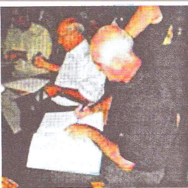
Prefeito assinando convênio

terá até o fim do ano 03 grandes obras sendo 01 Quadra Poliesportiva coberta, 01 Posto de Saúde e 01 Calçadão.