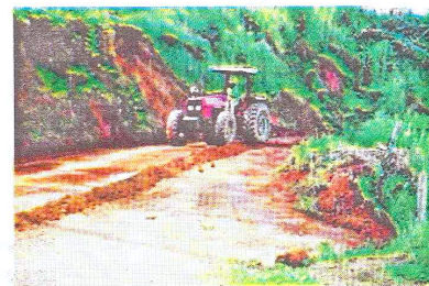
Terraplanagem da Rua Belmiro Candido da Silva

Completando o calçamento do bairro, já foram iniciados os trabalhos de drenagem da rua Wantuil Costa que também receberá calçamento em breve além da captação de água e terraplanagem da rua Belmiro Candido da Silva que também será calçada. A Rua Oswaldo Machado, principal acesso para a comunidade do Bom Sucesso, também terá concluído seu calçamento.