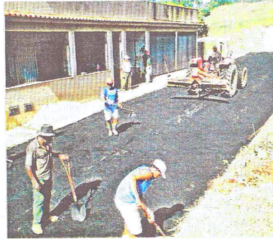
Asfalto no bairro Giacomino Trezza

bertura de massa asfáltica beneficiando os moradores que já solicitavam o serviço de melhoria a mais de 08 anos. Por causa dos problemas das frequentes inundações algumas das ruas foram apelidadas de rua do sapo, pois a rua tinha aparência de brejo, encharco ou coisa parecida. Hoje totalmente pavimentada, o bairro Giacomino Trezza nem parece mais o mesmo.