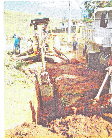
Drenagem da rua Wantuil Costa