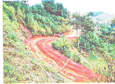
Terraplanagem da Belmiro Candido da Silva