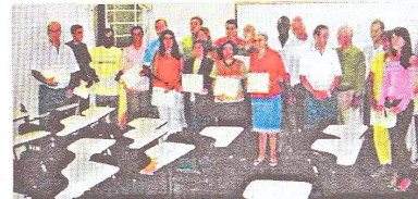
CMDCA na Posse

Com a nova diretoria empossada, o CMDCA, já teve como importante tarefa a montagem de novo processo eleitoral para o Conselho Tutelar. Sendo anunciado e publicado através do Edital 001/2006 o regulamento para os candidatos ao Cargo de Conselheiro Tutelar, bem como as exigências para as entidades comporem o colégio eleitoral.