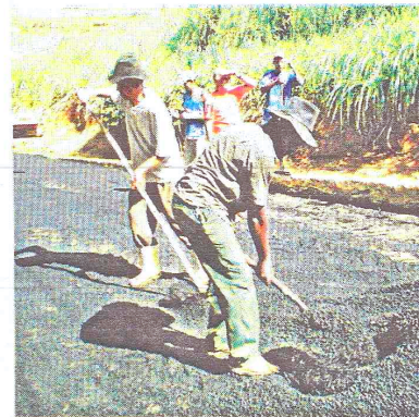
Massa asfáltica no bairro Giacomino Trezza

Completando o calçamento do bairro, já foram iniciados os trabalhos de drenagem da rua Wantuil Costa que também receberá calçamento em breve além da captação de água e terraplanagem da rua Belmiro Candido da Silva que também será calçada. A Rua Oswaldo Machado, principal acesso para a comunidade do Bom Sucesso, também terá concluído seu calçamento.