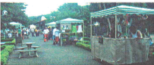
Desenvolvimento das Indústrias de Pequeri, Exposição reúne Empresários Locais e da Região