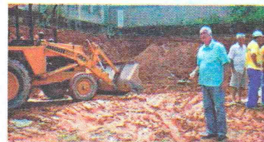
O prefeito visitando as obras de desaterro para aumento do Parque de Exposições

Por ser Maripá de Minas, uma cidade com sua economia voltada para a produção de leite e tendo em vista as dificuldades encontradas pelos produtores, a Prefeitura Municipal resolveu investir e incentivar todas as alternativas para o impulsionamento do setor. A primeira ação será a de valorizar a produção existente com a melhor exposição dos animais no concurso leiteiro e para tanto, estão sendo executadas as obras de reestruturação das baias, construção de espaço para barracas de alvenaria e de tendas