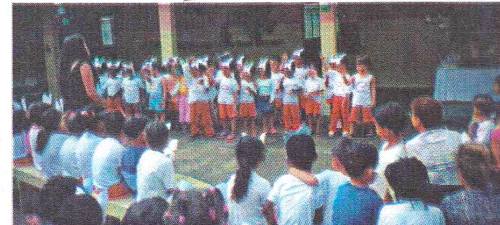
Vista parcial da festa da Páscoa no Jardim de Infância Municipal "Zara Queiroz Vanni" em Pequeri