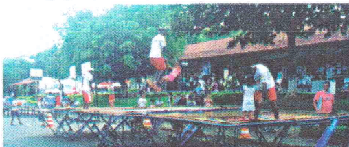
Sec. Desenvolvimento Social e Esportes em parceria com a Prefeitura de Pequeri fazem a alegria da criançada.