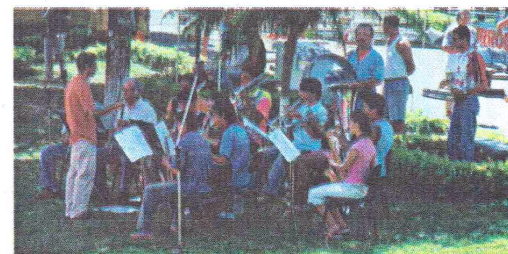
Banda de Música na praça, a Cultura ao alcance de todos