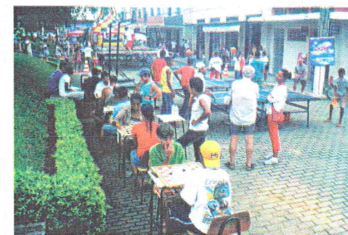
Projeto Comunidade em Ação começa com o Pé Direito e reúne todas as idades, é só alegria