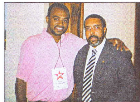
Na foto Dornê e o Senador Paulo Páim