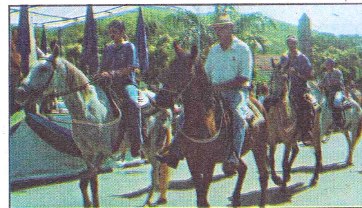
O Clube do Cavallo de Maripá de Minas esteve participando do desfile da 7ª Semana da Cidadania, conforme podemos ver na foto.