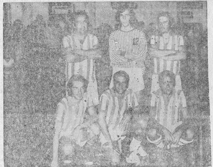
Time da ORGANIZAÇÃO FAMA, campeão do Torneio Relâmpago Salonista de Bicas

Transcorreram com grande brilho as comemorações do 53º aniversário do Sport Club Biquense, tendo sido cumprida a excelente programação organizada pela direção do veterano clube de nossa cidade.