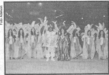
Comissão de frente da E. S. Unidos do Areião