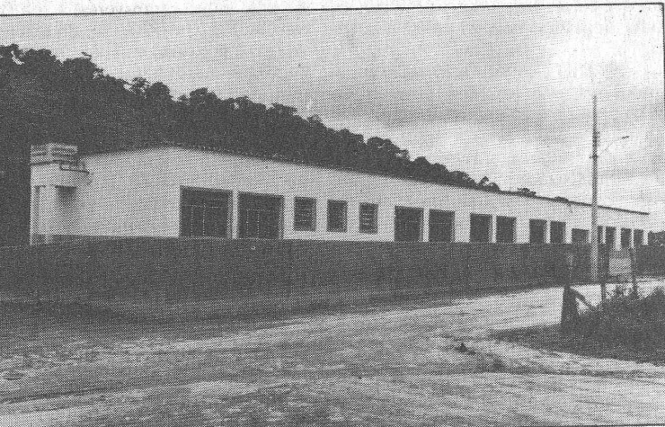
Escola Municipal Prof. Maria Antonieta Gomes de Souza - Bairro Alto das Brisas

A Administração Municipal preocupou-se em levar aos jovens e crianças, um programa educacional bem estruturado e permitindo assistir às crianças carentes da cidade e do setor rural. Procurou melhorar as instalações das escolas municipais, amando-as quando necessário, recuperando substituindo o mobiliário e levando aos alunos, material escolar gratuito, a medida, os princípios fundamentais de higiene, vacina periódica e o transporte diário de alunos e professores.