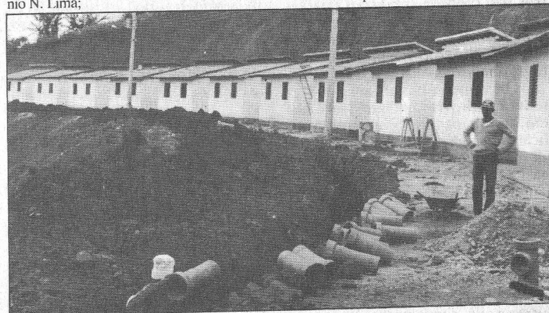
Casas populares com serviços de iluminação, água, esgoto e águas pluviais

Como vimos foi grande a atuação da prefeitura junto a setores mais carentes de nosso município.