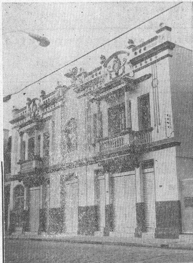
A foto acima é do novo CLUBE BIQUENSE, o mais jovem orgulho da cidade.