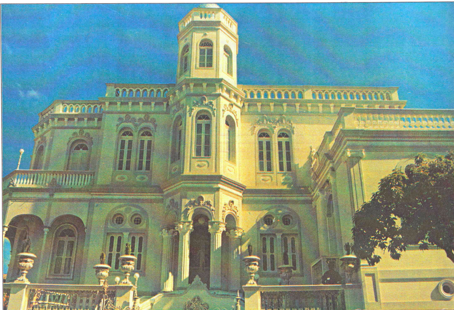
Castelo Bolivar Caramuru de Oliveira, sede do Grupo CJF em Juiz de Fora