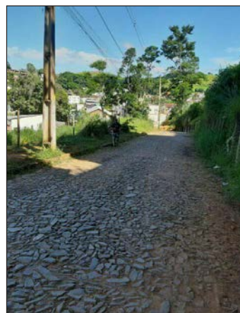
■ Capina da rua Floriano Peixoto