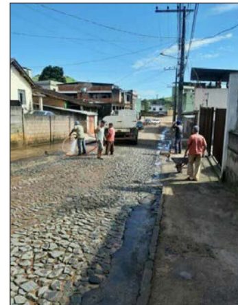
■ Lavando a rua Álvaro Dias