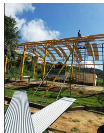
■ Construção da cobertura da quadra do bairro Gilson Lamha