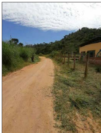
■ Manutenção das estradas rurais