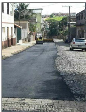
■ Asfaltando a rua Álvaro Dias