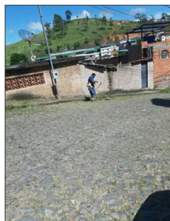
■ Capina no bairro Edgar Moreira