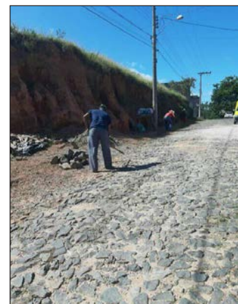
■ Capina no bairro São Pedro