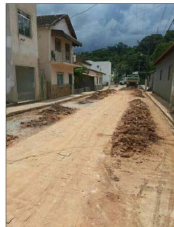
■ Calçamento da rua Barro Gomes