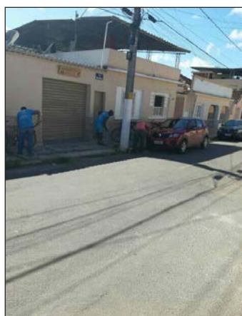
■ Capina na rua Dona Miquelina e adjacências