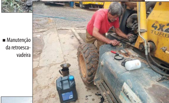
■ Manutenção da retroscavadeira