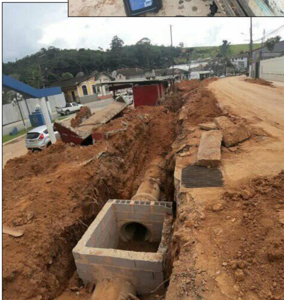
■ Canalização e construção de caixas coletoras de captação de águas pluviais entre as ruas Prefeito Oliveira Souza e Dr. Melo Viana