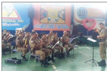
■ Banda de Música da PMMG