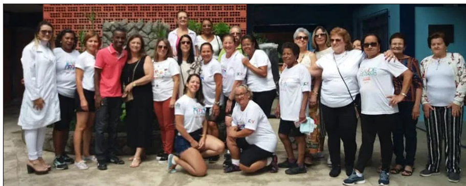
■ Todos unidos em prol da causa

cia Militar realizaram várias atividades na E.E. Deputado Oliveira Souza, em comemoração ao Dia Internacional da Mulher.