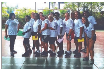
■ Grupo Saúde em Movimento, da Secretaria de Saúde