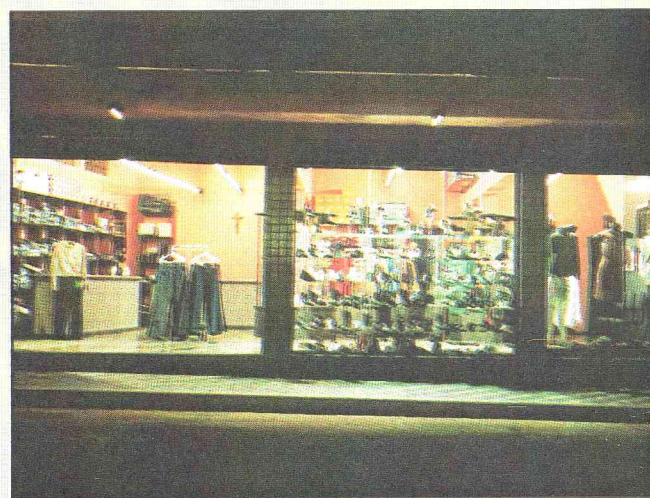
Vista externa da loja

FOI INAUGURADA EM NOSSA CIDADE A LOJA "A+ FASHION", SITUADA À PRAÇA SÃO JOSÉ Nº 41, OFERECENDO OS MAIS RECENTES LANÇAMENTOS DA MODA.