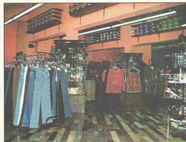
Vista interna da Loja

"A+ FASHION É MAIS DO QUE POSITIVO, É FASHION".