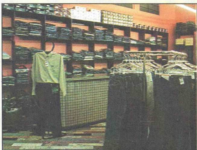
Vista interna da loja

SUAS NOVAS INSTALAÇÕES, AMPLAS E MODERNAS, OFERECEM MAIS CONFORTO E VARIEDADE DE MERCADORIAS AOS SEUS INÚMEROS CLIENTES E AMIGOS.