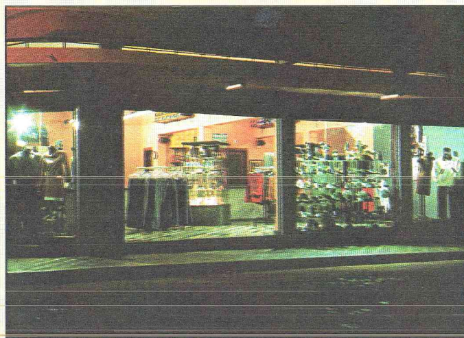
Vista da fachada

CALÇADOS, CONFECÇÕES MASCULINAS E FEMININAS, NAS MAIS FAMOSAS MARCAS E MODELOS, PARA VOCÊ QUE PROCURA PREÇO, QUALIDADE E FACILIDADE DE PAGAMENTO.