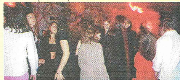
1ª Festa Halloween do CCAA