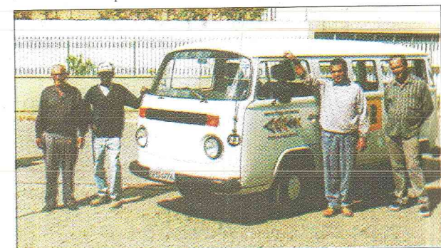
Kombi nova para transporte de alunos