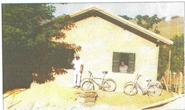
Reforma de casa popular no Bairro Saracura