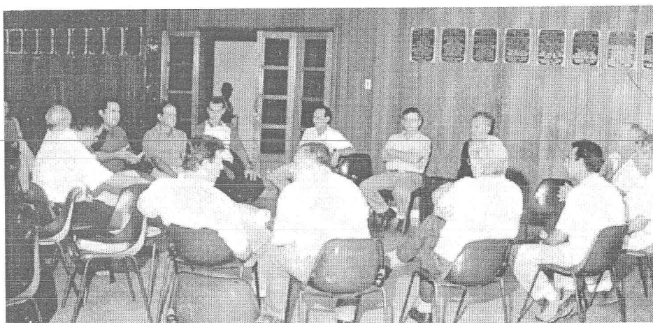
As fotos retratam (acima) a Reunião para informar o produtor Rural sobre a previdência social e (abaixo) a Reunião para discussão da idéia sobre fruticultura como fórmula de apresentar uma alternativa de renda suplementar à receita do produtor rural.