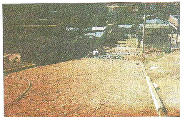
Calçamento na R. Said Salomão

10- Voltou a circular o onibus de estudantes para Juiz de Fora transportando diariamente 88 alunos;