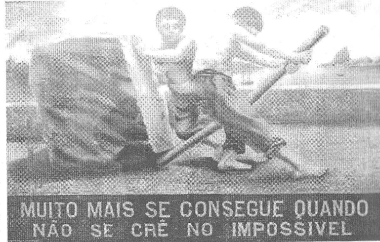
ilustração de Antônio Granato

Por tudo isso, é necessário que a sugestão de um