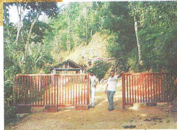
Obras na Agua Santa

Excursão dos alunos da E.M. Cel. Souza a Juiz de Fora para as-