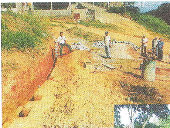
Muro de Arrimo no Bairro Edgar Moreira

8- Exposição: Continuam as obras de preparação do parque para o evento que se