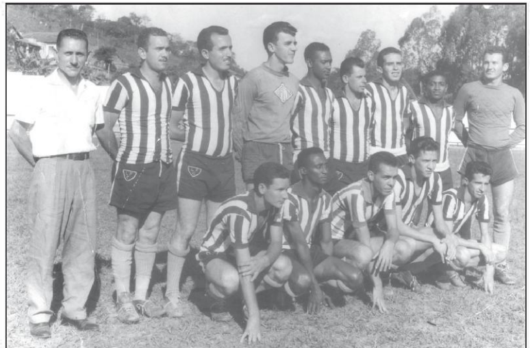
■ Leopoldina F.C. - 02-12-62