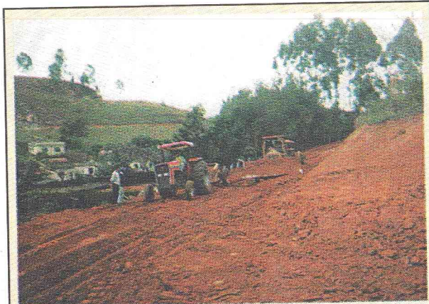
Ampliação e reforma do Parque de Exposições Francisco Retto Filho. O Serviço de Terraplenagem em convênio com o SEAM, conseguido através do Deputado Estadual Sebastião Helvécio

E o homem pegou febre. De repente, monumental obra de ampliação do Parque de Exposições. Finalmente, a partir do próximo ano, haverá um amplo e bem situado estacionamento, nova localização do picadeiro para rodeios e outros fins e, diversas outras melhorias que vão aumentar a segurança e conforto dos usuários do Parque.