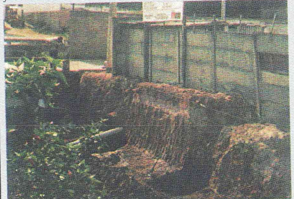
Início das Obras de Canalização do Córrego São José