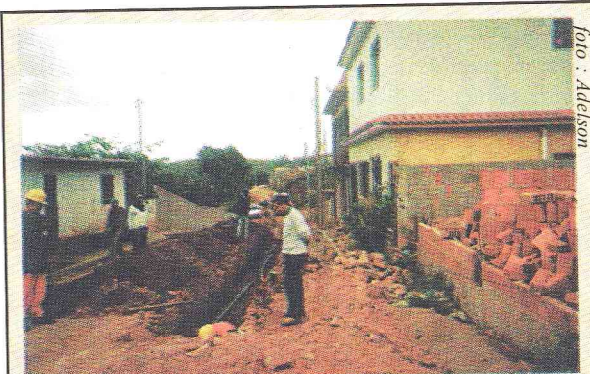
Colocação de Água e Rede de Esgoto no Bairro Sta. Terezinha - Morro do Cruzeiro