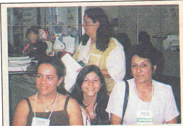
Cantinho da Leitura em Belo Horizonte