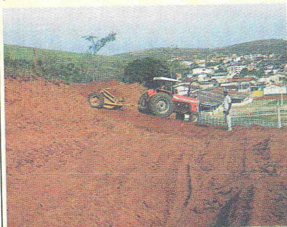
Serviços de terraplenagem no Parque de Exposição Francisco Retto Filho