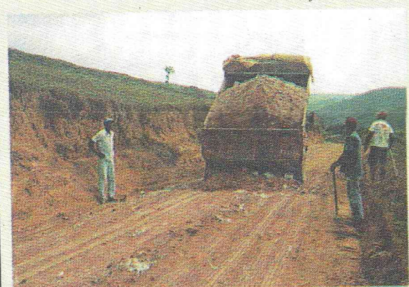
Patrolamento e ensaibramento de estradas rurais Captação de águas pluviais