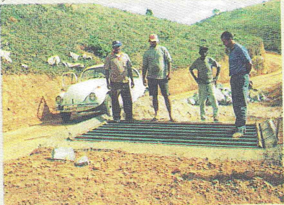
Colocação de mata-burro em estradas rurais, facilitando o acesso aos meios de transportes, inclusive caminhões de leite