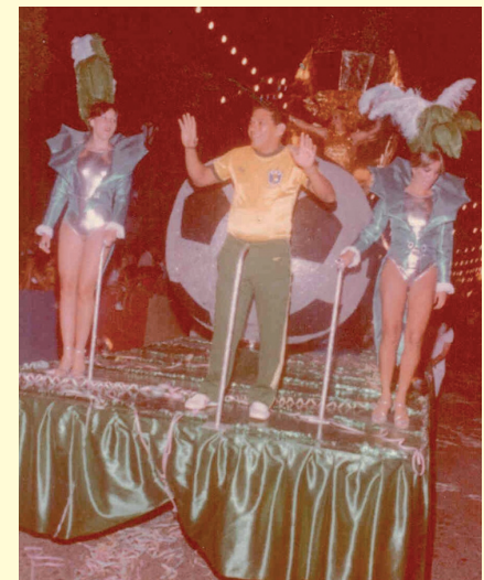
■ Mané Garrincha no carro da Real Biquense