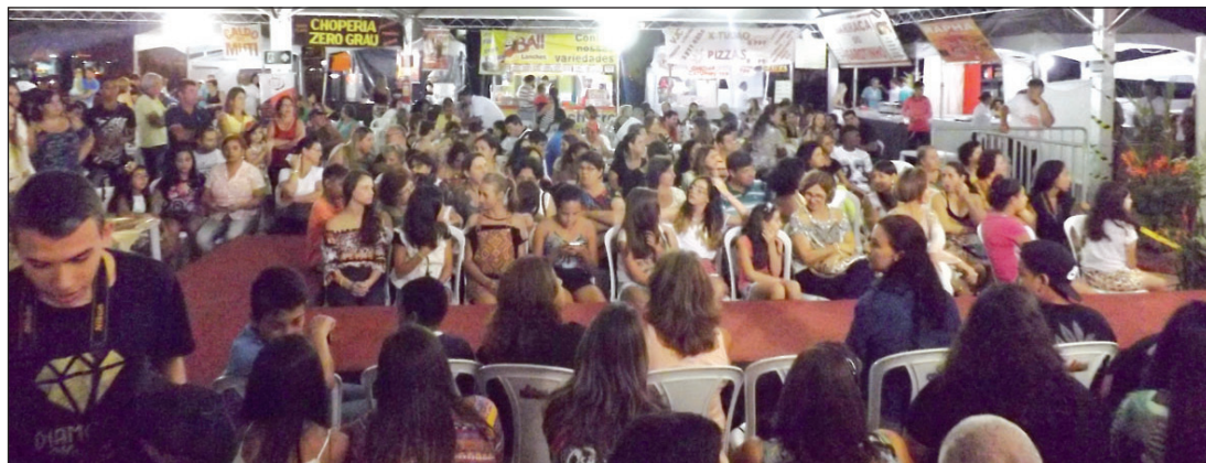
■ Público prestigiando o 4º. Bicas Liquida