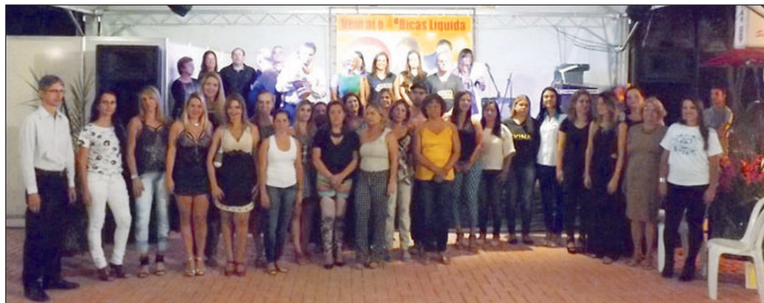
■ Abertura do 4º. Bicas Liquida