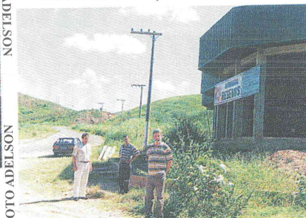
Posteamento e mudança do fio de alta tensão Marmoraria Rezende