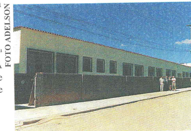
Ampliação, reforma do muro, calçada, pintura, salão de festas, quadra, etc. Escola Municipal M a Antonieta Gomes de Souza