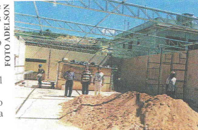
Ampliação, reforma do muro, calçada, pintura, salão de festas, quadra, etc. Escola Municipal M a Antonieta Gomes de Souza