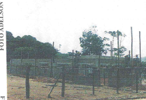
Reforma e ampliação da Escola Rural Athayde Suriano Pereira